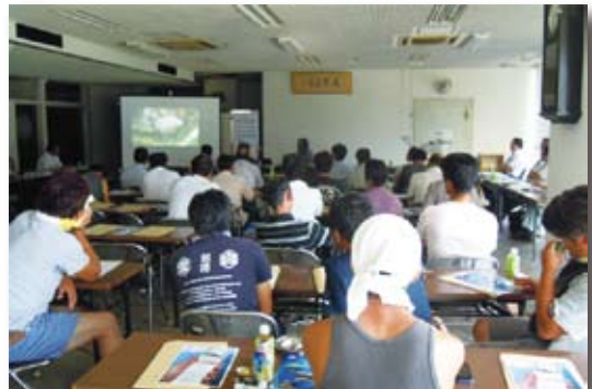
藻場造成のための勉強会の状況(宮城県女川町)