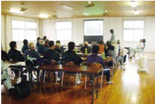
漁場造成についての勉強会の状況(大分県杵築市)

これからの漁業を盛り上げていくために、全国の様々な地区で漁業者が主体となった漁場造成などについての勉強会、交流大会などを実施しています。