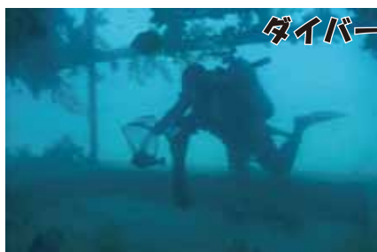
ダイバーがオニオコゼを捕獲