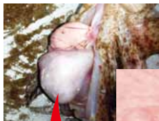
胃の中からは ネンブツダイが!!