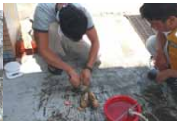
腹を開いてみると…