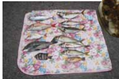
釣果① アジ、タイなど