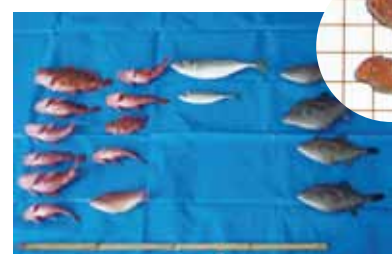
釣果② アジ、カサゴなど