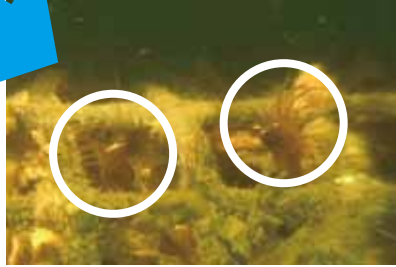
アップで見ると 隠れている小エビを発見！！

沈設したシェルナースにはフジツボ類、ホヤ類、海綿動物などの動物が着生しており、内部にはエビ類やカニ類など魚介類の餌になる生き物がたくさん生息しています。