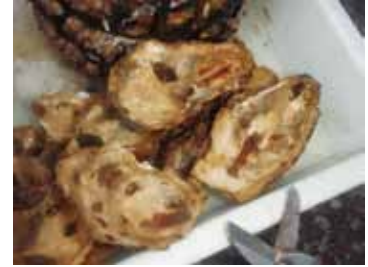
引き揚げた基質からも 多くの生き物を確認

餌になる生き物がたくさん生息しているシェルナースには、イサキの群れ、ハタ類、メバル、イセエビなど様々な魚介類が集まり、海藻も繁茂しています。