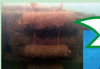
シェルナースの横に調査用のパイプを設置