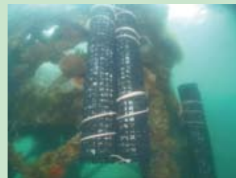
既存の採苗施設に設置