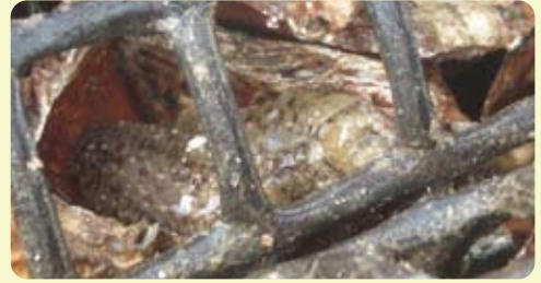
カキ殻パイプに隠れるナマコ

貝殻の隙間や海藻の陰に大小様々なナマコが見つかった事例を挙げ、JF シェルナースがナマコの隠れ場、エサ場になっていることを紹介しました。