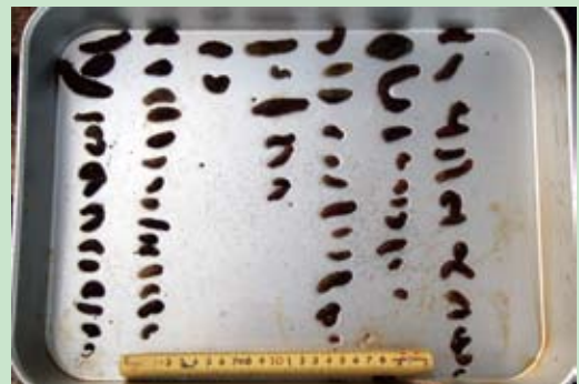
大量の稚ナマコが生息！！