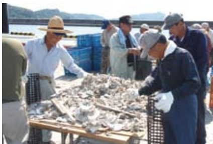
シェルナース基質製作体験