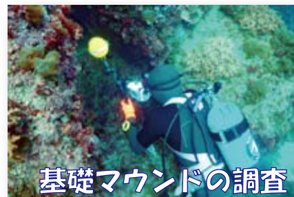
基礎マウンドの調査