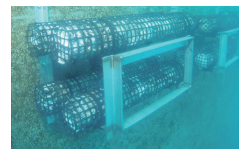
壁面取り付けタイプ