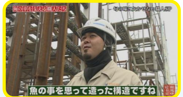
和風総本家VTRより抜粋