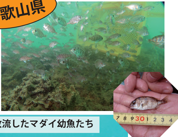
放流したマダイ幼魚たち