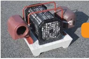
従来製品：重量 約 70kg