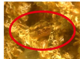
貝藻くんに生息する カタユウレイボヤ (上) とハゼ類 (下)

これらの動物のうち、海水の濁りの原因である懸濁物やプランクトンなどを食べる「ろ過食性」動物が、海水をろ過することで水質を浄化することが知られています。今回確認された動物の中では、二枚貝の仲間のミドリイガイやマガキ、ホヤの仲間のカタユウレイボヤ、シロボヤなどがこれに当たります。