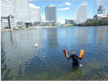
みなとみらいの実験場の風景

横浜みなとみらい 21 地区の実験場において、水質を浄化する生物の棲家を創るために、2018年12月から貝藻くん 8 基を設置しています。