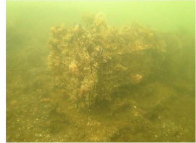
設置 19 カ月後の貝藻くん

2020年7月（設置 19 カ月後）に貝藻くんを引き上げて調べたところ、58種、4,380 個体もの動物が生息していることが分かりました。個体数ではゴカイ類などの多毛類、重量ではカタユウレイボヤなどのホヤ類が多く見られました。