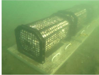
設置直後の貝藻くん